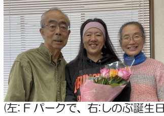
(左:Fパークで、右:しのぶ誕生日)